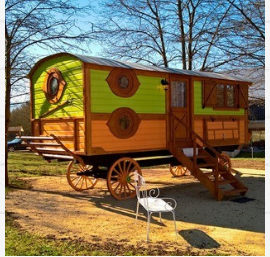
Nuit insolite aux Roulottes du Vercors

Chambre d'hôte Le Mas de Servant ( site internet )