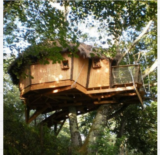
Séjour aux Cabanes de Carpat