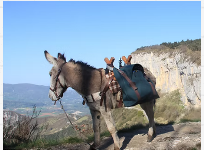
Canaille est prêt à vous accueillir

Nous vous fourniront l'itinéraire précis (tracé GPX avec l'application téléphone WeTrek à télécharger) avec des explications sur tout le parcours, et restons joignables à tout moment.