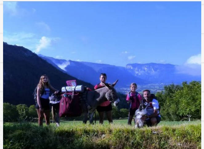
En avant l'aventure avec Ascott