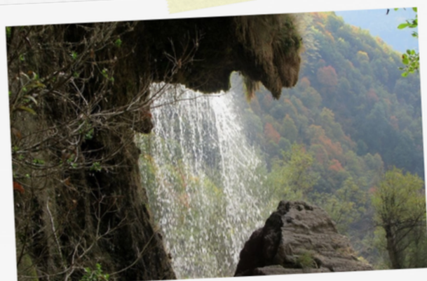
10 Grotte et cascade à Choranche