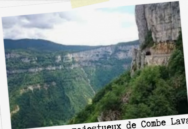
2 Le cirque majestueux de Combe Laval