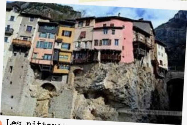
9 Les pittoresques maisons suspendues