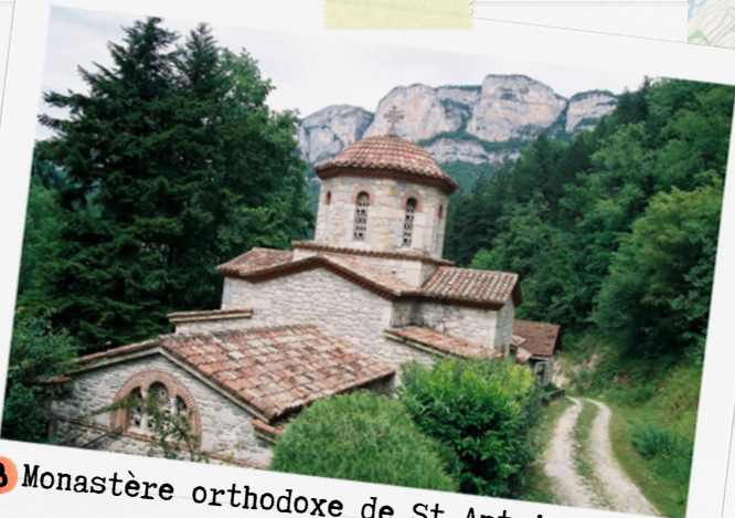
3 Monastère orthodoxe de St-Antoine Le Grand

Pour cette randonnée, les gîtes sont souvent victimes de leur succès l'été ! Nous vous recommandons donc de réserver 2 nuits au même endroit (la première la veille de votre départ, la deuxième après le premier jour de marche).