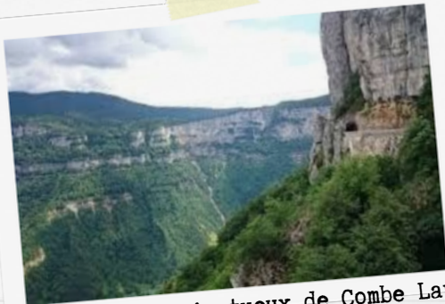
2 Le cirque majestueux de Combe Laval