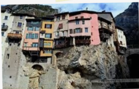
4 Les pittoresques maisons suspendues