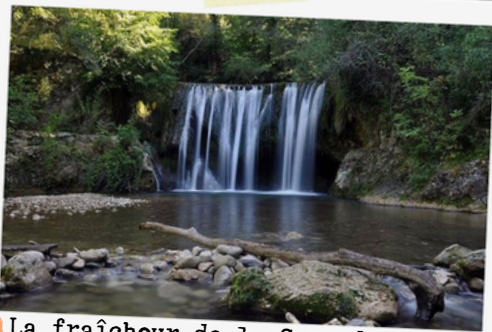
3 La fraîcheur de la Cascade Blanche