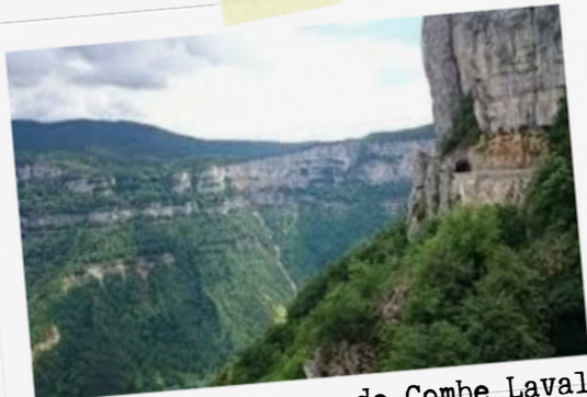
2 Vue sur le cirque de Combe Laval