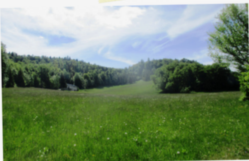
4 Prairies et cascades de Val Ste-Marie