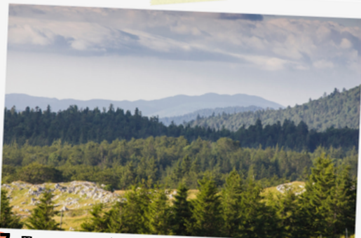
17 Traversée de la forêt de Lente