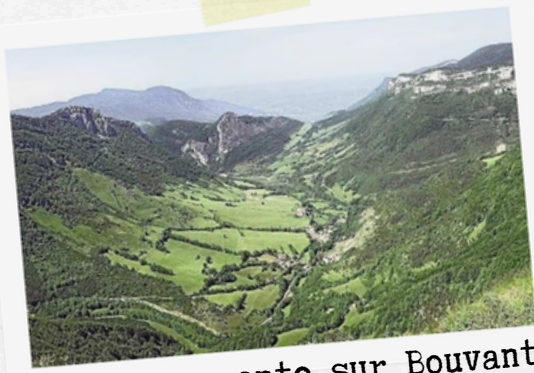
12 Vue plongeante sur Bouvante

Durée de marche variable en fonction d'où vous dormez