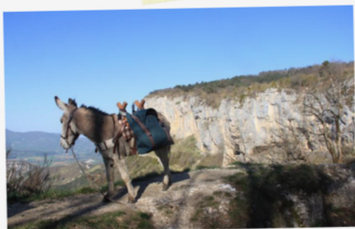
18 Canaille admirant la vallée