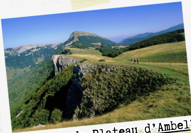
"Tour du Plateau d'Ambel" 15 km / 500 m D+ 6h de marche

Rando, repos avec les ânes, trail ... suivant votre humeur :)