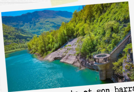
9 Lac de Bouvante et son barrage