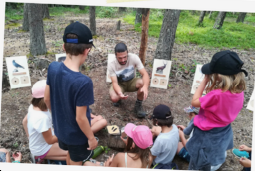
23 Sortie nature sur les traces du loup