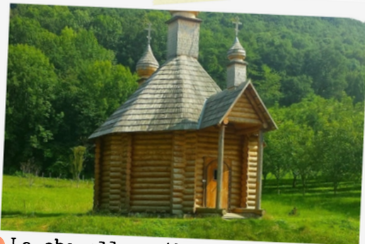
3 La chapelle orthodoxe des Carpates