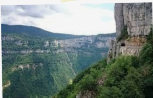
24 Vue sur les falaises de Combe Laval