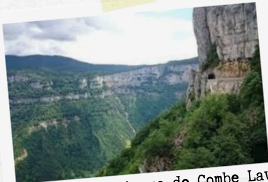
2 Vue sur le cirque de Combe Laval