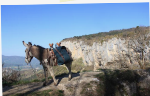
18 Canaille admirant la vallée