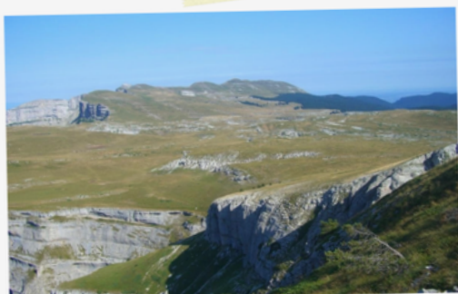
14 Les alpages de Font d'Urle