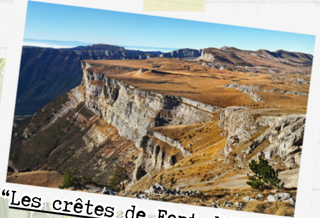
"Les crêtes de Font d'Urle" 10 km / 250 m D+ 3h30 de marche