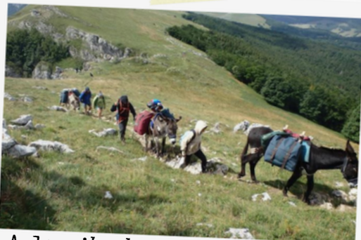
13 A la ribambelle au plateau d'Ambel