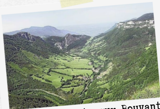
12 Vue plongeante sur Bouvante

Durée de marche variable en fonction d'où vous dormez