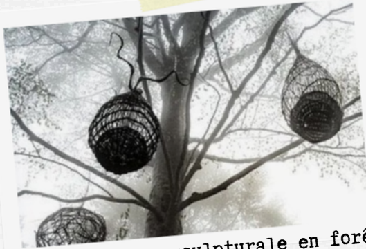
22 Déambulation sculpturale en forêt