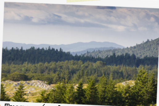
17 Traversée de la forêt de Lente