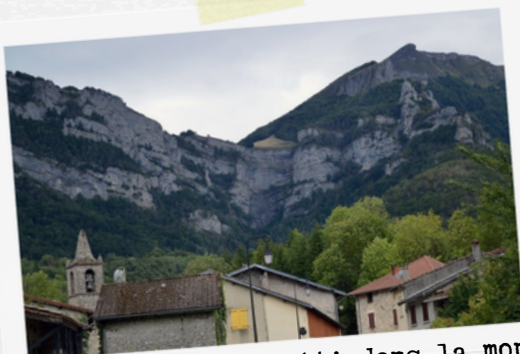
10 Vieux village blotti dans la montagne

Une zone de bivouac est aménagé dans le village. Contacter L'Affut Gourmand pour parquer les ânes. Rivière, Fontaine, toilette public.