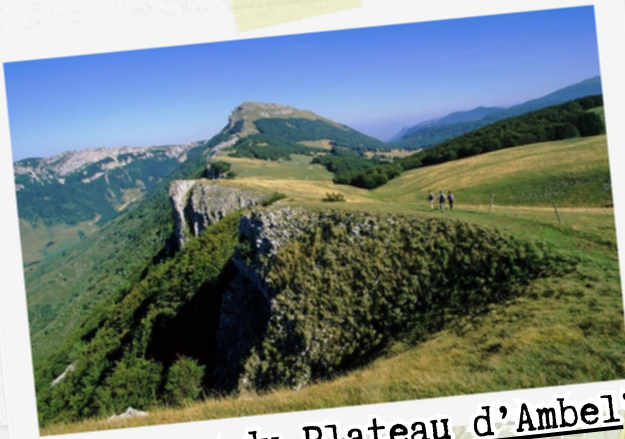
"Tour du Plateau d'Ambel" 15 km / 500 m D+ 6h de marche

Rando, repos avec les ânes, trail ... suivant votre humeur :)