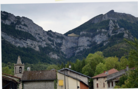
4 Vieux village blotti dans la montagne