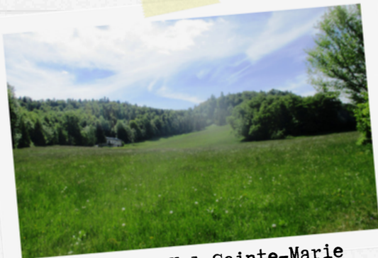
2 Prairies de Val Sainte-Marie