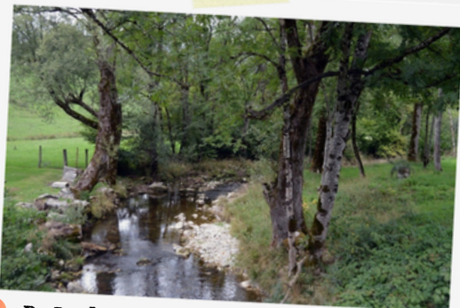
3 Balade le long de la Lyonne